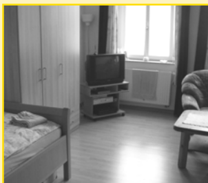
Einzelzimmer in WG